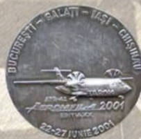
ARIPI PEȘTE PRUT, 2001