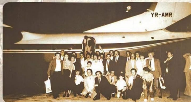
Delegația care a făcut cel dintâi zbor București - Chișinău, ceea ce a avut ca urmare înființarea curselor regulate între cele două capitale românești.

În această perioadă, Moldova începea să se contureze tot mai clar pe harta internațională a transportului aerian.